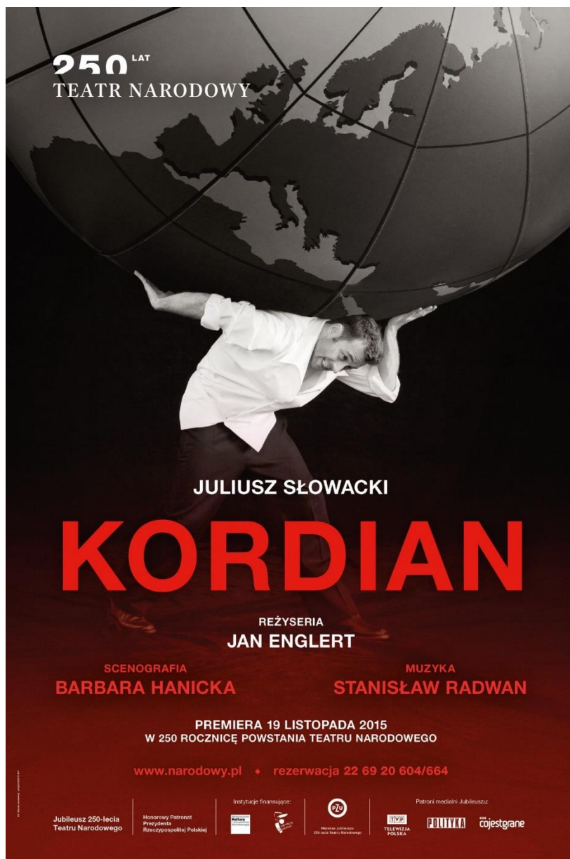
Plakat do przedstawienia Kordian – fot. Maciej Landsberg, projekt: Elipsy, Archiwum Artystyczne Teatru Narodowego, www.narodowy.pl

Zapoznaj się z plakatem do przedstawienia Kordian według dramatu Juliusza Słowackiego.